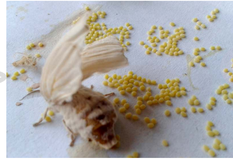
HUEVOS, COLOR Y MADURACIÓN, CONSERVACIÓN EN HELADERA