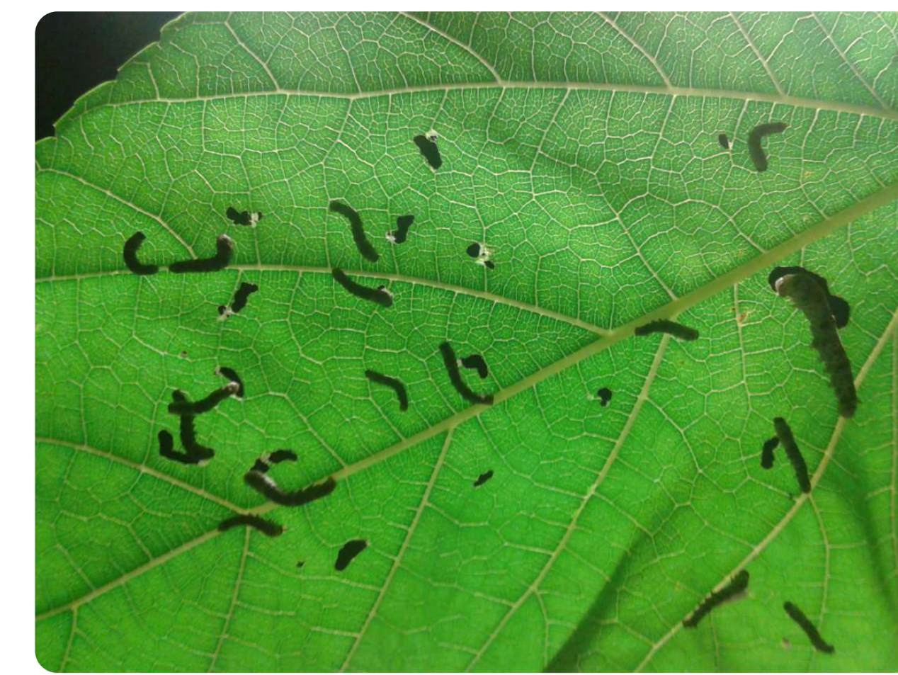
EN PRIMAVERA, LOS MOREROS BROTRAN Y LOS HUEVOS ECLOSIANAN.